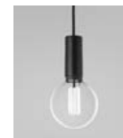
Cob inkl. ljuskälla Caret Globe

L 1050000013 = Cobbler inkl. ljuskälla Caret Globe med svart huvudskärm och vit dekorskärm.