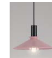
5 Cobbler Puderrosa