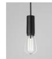
Cob inkl. ljuskälla Caret Standard