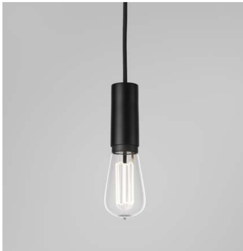
Cob inkl. ljuskälla Caret Standard