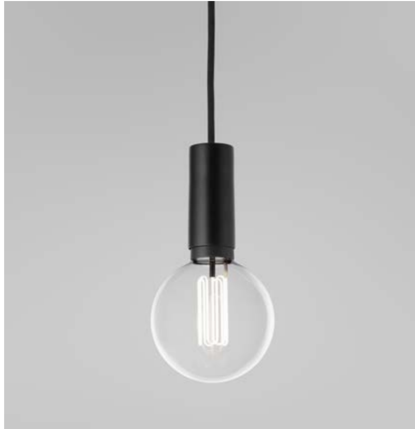
Cob inkl. ljuskälla Caret Globe