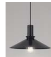
1: Cobbler Svart