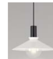
3: Cobbler Vit