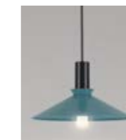
4: Cobbler Petroleumblå