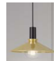
2: Cobbler Champagne