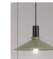
6: Cobbler Pudergrön